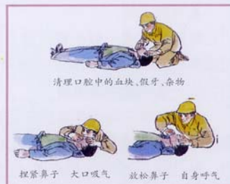
清理口腔中的血块、假牙、杂物